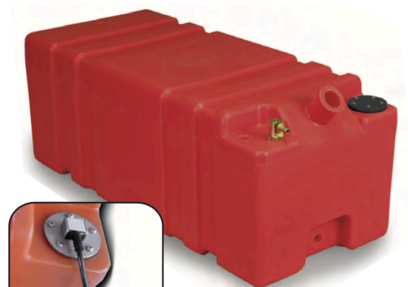
IPC 5110/C - IPC 5112/C

ADAPTADOR RETO DE MANGUEIRA DE 50 mm INCLUÍDO