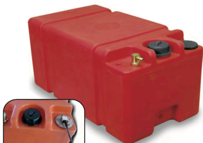
IPC 5110 - IPC 5112