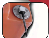
IPC 5110/R-AF - IPC 5112/R-AF