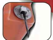
IPC 5110/C-AF - IPC 5112/C-AF