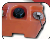
IPC 5110-AF - IPC 5112-AF